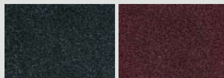
Gris ardoise 30