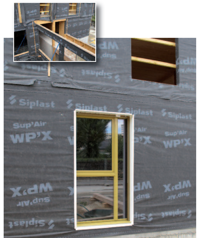
"Les passages du Languedoc", Groupe de 52 logements BBC à Rennes, CO-BE Architecture et Paysage, www.cobe.fr