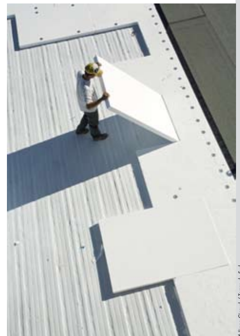
Philippe Giraud / Terres du Sud

Le choix de Knauf Therm TTI Th 36 SE BA , isolant en polystyrène expansé régulièrement utilisé pour l'isolation des toitures industrielles s'est imposé par ses excellentes performances thermiques, sa légèreté, sa résistance mécanique et sa facilité de mise en œuvre.