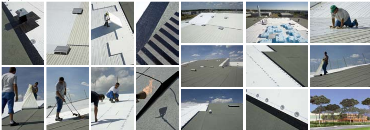
doc. Architecture technologie et environnement