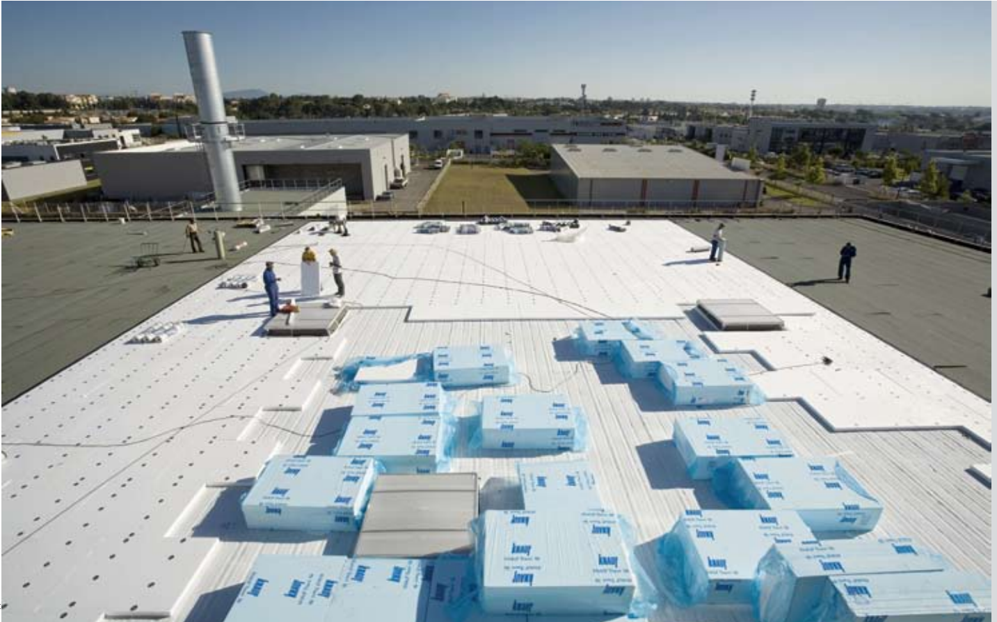
Philippe Giraud / Terres du Sud