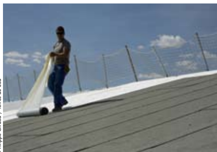
Philippe Giraud / Terres du Sud