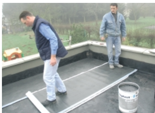
Pose de l'Adestar.

Ce procédé voit son domaine d'emploi aujourd'hui élargi aux terrasses avec dalles sur plots de moins de 25 m 2 .