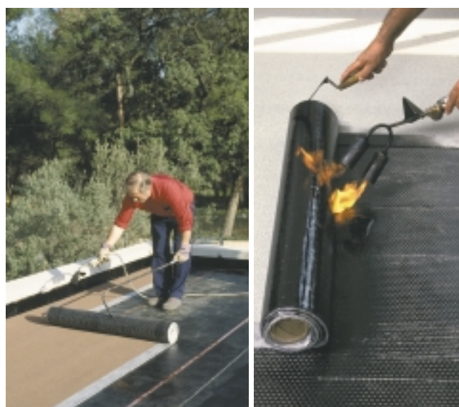
Le procédé Parastar (photos ci-dessus) intègre à présent une première couche adhésive qui permet d'éviter l'utilisation d'écran d'indépendance simplifiant de fait la mise en œuvre.

La nouvelle gamme STAR s'articule autour de deux procédés : le PARASTAR, un système d'étanchéité polyvalent à chaud, et ADESTAR, une étanchéité monocouche 100 % à froid.